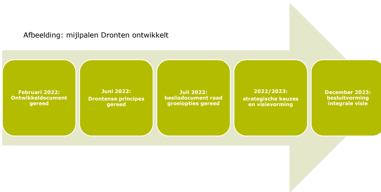
Afbeelding: mijlpalen Dronten ontwikkelt

De inhoud van deze procesnotitie vraagt extra tijd ten opzichte van de visieplanning in de bestuurlijke startnotitie. Evenals de raad vinden ook het college en de organisatie het belangrijk dat de samenleving ruim de tijd krijgt om goed betrokken te worden en daarmee mede-eigenaar te worden van de visie. Zorgvuldigheid staat voorop. Dat betekent dat de doorlooptijd van het integrale visietraject een jaar langer zal duren. Zoals aangegeven: de groeiopties voor de woningbouwopgave zijn voor de zomer 2022 gereed. Oplevering en vaststelling van de integrale visie wordt eind 2023. Daarmee redden we de verplichte opleverdatum van 1 januari 2024.